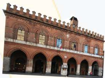
Palazzo del Comune