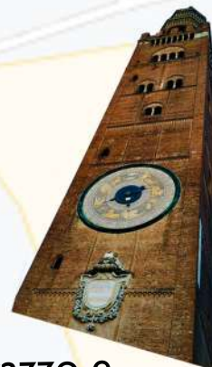
Torrizzo e Museo Verticale

Ingressi a pagamento (facoltativi): Salita al Torrizzo e ingresso al Battistero 5€.