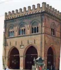
Loggia dei Militi